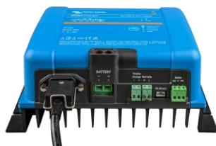
Chargeur Smart IP43 12/50(1+1)