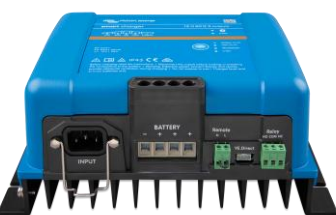
Chargeur Smart IP43 12/50(3)