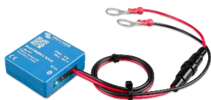
Détection Bluetooth : Smart Battery Sense