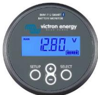
Détection Bluetooth : Contrôleur de batterie BMW-712 Smart