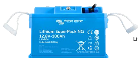
Lithium SuperPack 12,8/100 NG