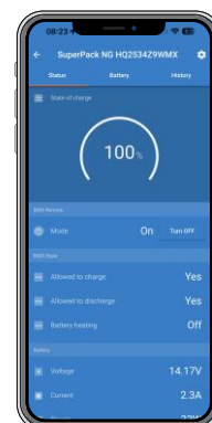
Données de batterie en temps réel affichées dans VictronConnect