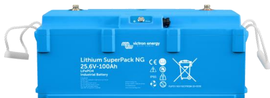
Lithium SuperPack 12,8/200 NG & 25,6/100 NG