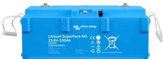
Lithium SuperPack 25,6/100 NG & 25,6/200 NG