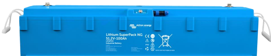
Lithium SuperPack 25,6/200 NG & 51,2/100 NG