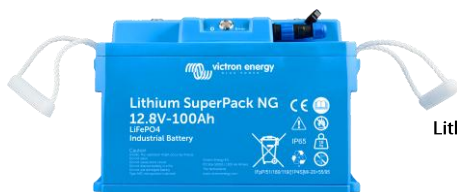
Lithium SuperPack 12,8/100 NG