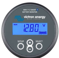
Bluetooth-Erkennung BMV-712 Smart Battery Monitor