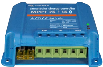
SmartSolar Lade-Regler MPPT 75/15