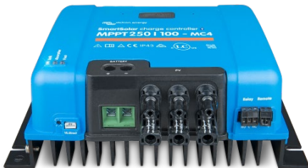
SmartSolar-Laderegler MPPT 250/100-MC4 ohne Display