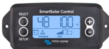
Einsteckbares SmartSolar display

Entfernen Sie einfach die Gummidichtung, die den Stecker an der Vorderseite des Reglers schützt und stecken Sie das Display ein.