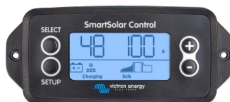
Écran à brancher SmartSolar

Retirez simplement le joint en caoutchouc qui protège la prise sur le devant du contrôleur puis insérez l'écran.