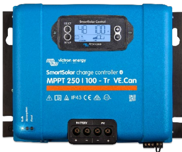
Contrôleur de charge SmartSolar MPPT 250/100-Tr VE.Can avec écran à brancher en option