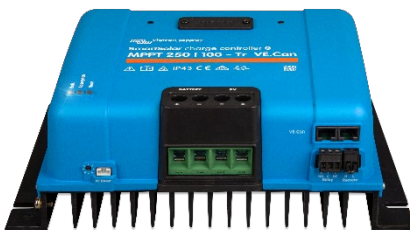
Contrôleur de charge SmartSolar MPPT 250/100-Tr VE.Can sans écran