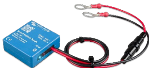
Détection Bluetooth : Sonde Smart Battery Sense