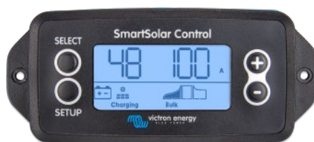
Écran à brancher SmartSolar

Retirez simplement le joint en caoutchouc qui protège la prise sur le devant du contrôleur puis insérez l'écran.