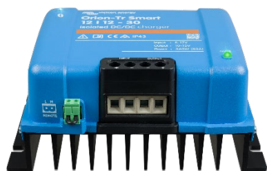
Orion-Tr Smart 12/12-30