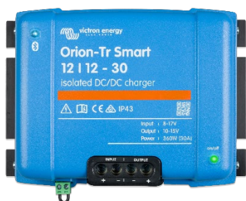
Orion-Tr Smart 12/12-30