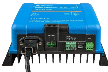
Phoenix Smart 12/50(1+1)