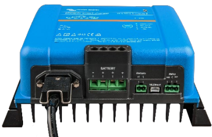
Phoenix Smart 12/50(3)