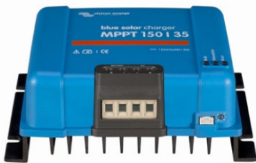
Solar-Laderegler MPPT 150/35