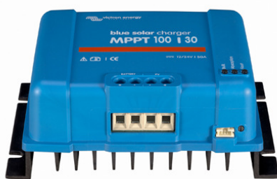
Solar-Laderegler MPPT 100/30