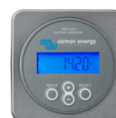
Tableau de commande Phoenix Inverter

Ce tableau peut être également utilisé avec un chargeur-convertisseur MultiPlus, lorsque la commutation automatique est requise mais pas la fonction chargeur. La luminosité des LED est automatiquement réduite pendant la nuit.