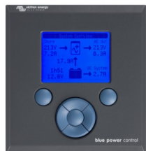
Tableau de commande Blue Power

Une solution pratique et bon marché pour une surveillance à distance, avec un bouton rotatif pour configurer les niveaux de Power Control et Power Assist.